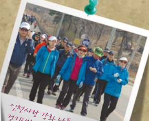
인척사랑 강화나들길 걷기대회