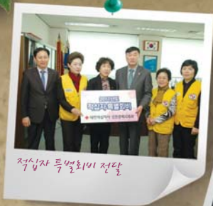
적십자 특별회비 전달