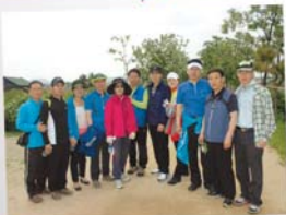
남동 문화생태누리길 걷기 행사