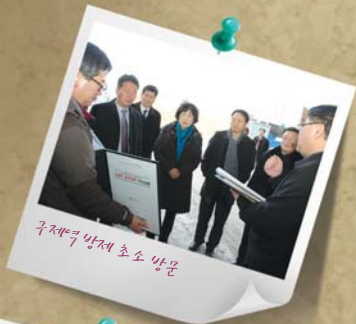
구제역 방제 초소 방문