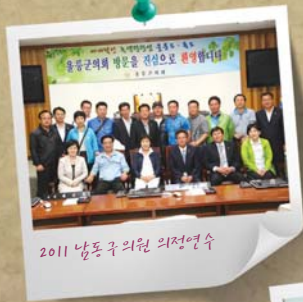
2011 남동구 의원 의정연수