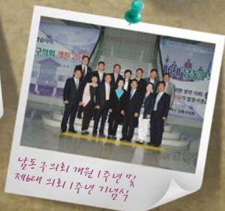
남동구의회 개원 1주년 및 제6회 의회 1주년 기념식