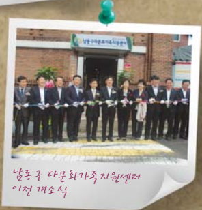
남동구 다문화가족지원센터 이전 개소식