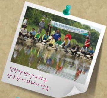
친환경 방역에 따른 장수천 미곡라지 방류