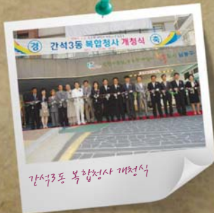
간석3동 복합청사 개청식