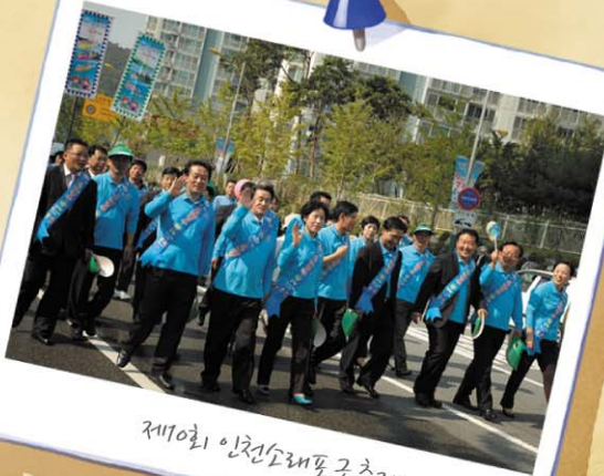
제10회 인천소래포구 축제