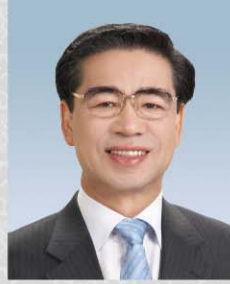
위원 윤석향 구월1·4, 남촌도림, 논현, 논현고잔