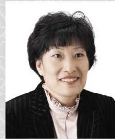
위원 서점원 비례대표