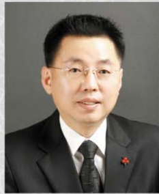
위원 조오상 구월2·3, 간석1·2·4