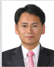
위원 용혜량 간석3, 만수2·3·5