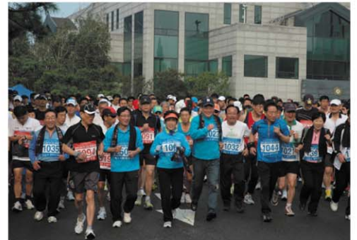
제8회 남동구민 건강마라톤대회

인천소래포구축제의 사전분위기 조성과 구민체육 활성화를 위한 남동구민 건강마라톤대회 참가.