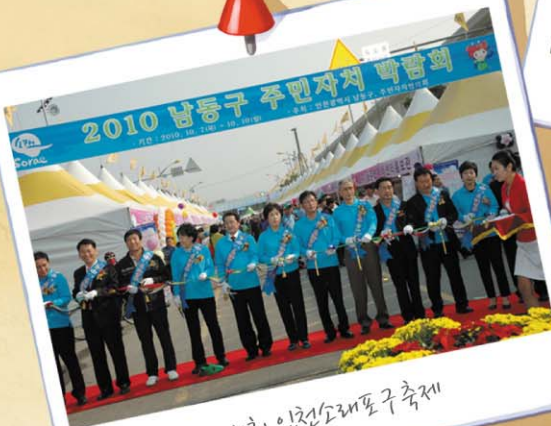
제10회 인천소래포구 축제