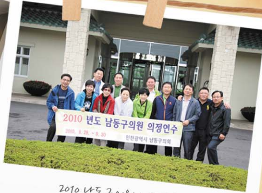
2010 남동구의원 의정연수

● 2010 남동구의원 의정연수 실시 2010. 9.28일부터 9.30일 기간 중 6대 의회개원에 따른 의원 의정연수에 참여하였다.