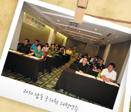
2010 남동구의원 의정연수