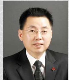
위원 조오상 구월2·3, 간석1·2·4