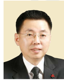
위원 조 오 상 구월2·3, 간석1·2·4