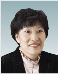
서점원 의원 (비례대표)

남동구민의 사랑으로 제가 이 자리에 올 수 있었기 때문에 받은 만큼 돌려드리려 노력하겠습니다.