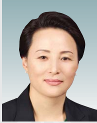
김은선 의원 (비례대표)