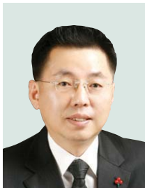
위원 조오상 구월2·3,간석1·2·4