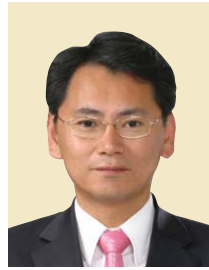
부위원장 용 해 랑 간석3, 만수2·3·5