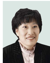
위원 서점원 비례대표