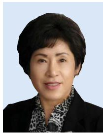
의장 천 정 숙 구월1·4, 남촌도림, 논현고잔