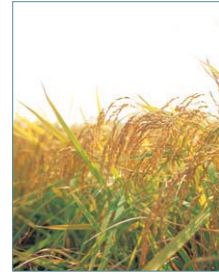
황금빛 벼가 익는 아름다운 들녘